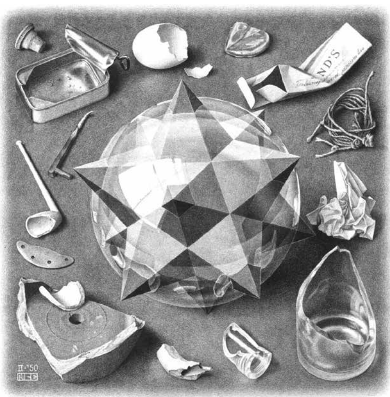
Порядок и хаос. Художник Мауриц Корнелис Эшер

Это мир тайного смысла и невидимых опор, невозможный в трёхмерном пространстве. Дали указывает на них названием одной из последних своих работ («В поисках четвёртого измерения»). Тут в центре внимания уже не искривлённое пространствoвремя Эйнштейна, символизируемое мягкими часами, этот почти отвергнутый образ Дали убирает на второй план, а на первый выплывает из мрака неведомого, который символизирует тёмная пещера, фигура додекаэдра – символ четырёхмерной «упаковки». И белый квадрат справа – знак просветления